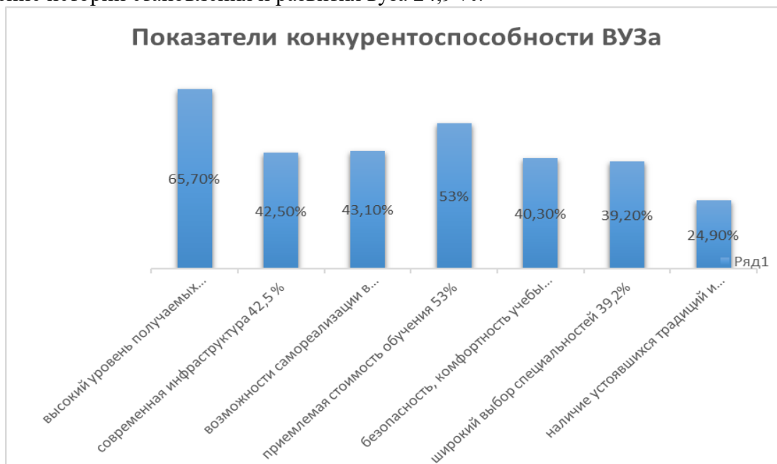
Рис. 2. Показатели конкурентоспособности ВУЗа

выбор специальностей 39,2%, наличие устоявшихся традиций и обычаев, бережное сохранение истории становления и развития вуза 24,9 %.